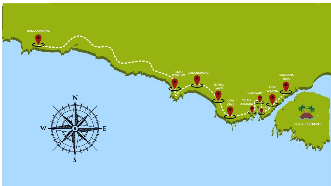
Gambar 1. Kawasan Pantai Kabupaten Malang

Pengabdian masyarakat ini berada di Kawasan Pesisir Kabupaten Malang, Kawasan pesisir tersebut terdiri dari enam kecamatan, yaitu: Kecamatan Bantur, Donomulyo, Gedangan, Tirtoyudo, Sumbermanjing, dan Ampelgading. Dalam enam kecamatan ini, diketahui terdapat 19 desa pesisir. Desa desa pesisir tersebut membentang membentuk garis pantai sepanjang 92,244 km. Sekaligus menjadi daerah persebaran lokasi wisata pantai yang terdapat di Kabupaten Malang. 11