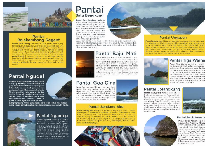
Gambar 3. Gambar Booklet