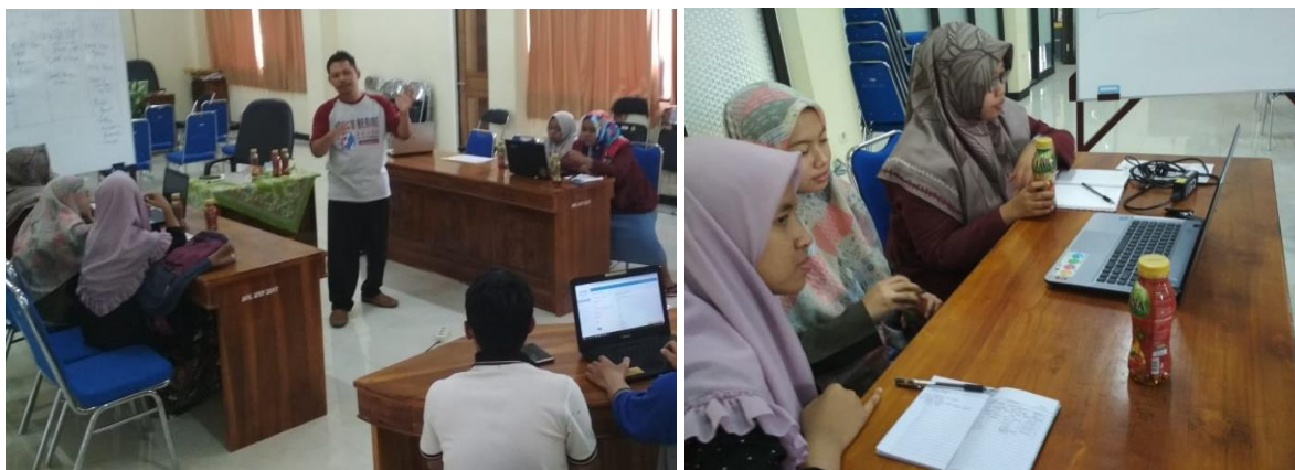
Gambar 3. Workshop Pengelolaan Sampah Berbasis IT

Para pengurus Biro Kebersihan dan Kesehatan langsung mempraktekkan sistem manajemen tata kelola sampah berbasis web maupun mobile. Mereka dikenalkan dengan berbagai fitur dan fasilitas yang dapat dimanfaatkan dalam tata kelola sampah terintegrasi di kawasan pesantren Ngalah. Sedangkan pendampingan instalasi sistem manajemen bank sampah IT merupakan tindak lanjut dari workshop agar mereka dapat lebih aplicable dalam mengimplementasikan sistem aplikasi bank sampah berbasis web dan mobile.