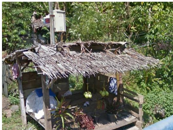
Gambar 6. Lokasi Penjualan Tanaman Hias KWT Mandiri