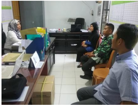
Gambar 3. Audiensi dengan Stakeholders

Penyuluh pertanian yang telah ditunjuk bersama dengan tim pengabdian kemudian memberikan penyuluhan kepada anggota KWT Mandiri mengenai proses bercocok tanam yang lebih efektif dan efisien. Agar proses bercocok tanam tersebut berhasil, perlu diketahui terlebih dahulu jenis tanaman yang cocok dan sesuai dengan kondisi daerah setempat. Dalam prosesnya, disepakati bahwa melihat potensi geografis dari lokasi pengabdian, KWT Mandiri dan penyuluh sepakat untuk memilih tanaman hias sebagai tanaman budidaya. Pemilihan jenis tanaman hias yang akan dibudidayakan sangat penting, sebab setiap tanaman hias memerlukan perawatan dan kebutuhan masing-masing. Kelurahan Battang yang merupakan dataran tinggi cocok untuk ditanami tanaman hias seperti anggrek, kembang sepatu, dan asoka.