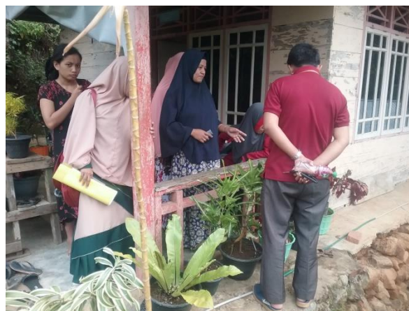
Gambar 4. Observasi dan Pemetaan Tanaman yang Sesuai dengan Keadaan Komunitas

Penyuluh pertanian yang telah ditunjuk bersama dengan tim pengabdian kemudian memberikan penyuluhan kepada anggota KWT Mandiri mengenai proses bercocok tanam yang lebih efektif dan efisien. Agar proses bercocok tanam tersebut berhasil, perlu diketahui terlebih dahulu jenis tanaman yang cocok dan sesuai dengan kondisi daerah setempat. Dalam prosesnya, disepakati bahwa melihat potensi geografis dari lokasi pengabdian, KWT Mandiri dan penyuluh sepakat untuk memilih tanaman hias sebagai tanaman budidaya. Pemilihan jenis tanaman hias yang akan dibudidayakan sangat penting, sebab setiap tanaman hias memerlukan perawatan dan kebutuhan masing-masing. Kelurahan Battang yang merupakan dataran tinggi cocok untuk ditanami tanaman hias seperti anggrek, kembang sepatu, dan asoka.