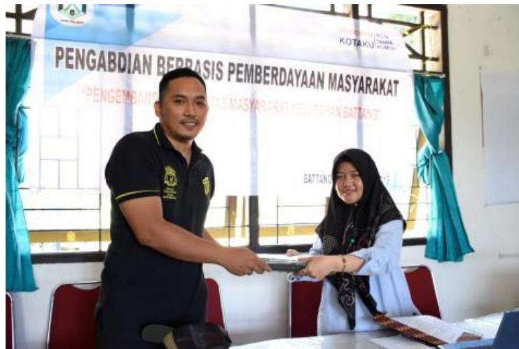
Gambar 5. Membangun Kemitraan dengan Stakeholders

Proses penyuluhan pertanian kemudian diakhiri dengan gotong royong antara kelompok sasaran dengan pemerintah daerah untuk membuat lokasi jual beli tanaman hias. Sudah ada tiga lokasi yang dibuat dalam kegiatan pengabdian ini. Ketiga lokasi ini berada di jalan poros agar lebih mudah diakses oleh pembeli.