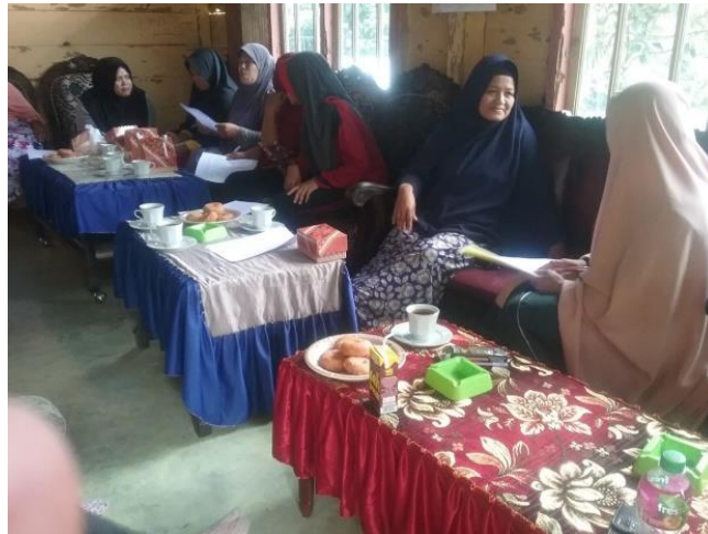
Gambar 2. FGD Menyusun Kegiatan bersama Kelompok Wanita Tani Mandiri

Pada pemetaan masalah ini, kelompok sasaran dan tim pengabdian menyusun beberapa harapan yang bisa diwujudkan. Pertama, perlu ada kemauan dan semangat dari setiap pihak dalam menjalankan kegiatan pemberdayaan. Kedua, perlu melakukan pemetaan potensi yang dimiliki oleh kelompok sasaran. Ketiga, semangat untuk mensejahterakan masyarakat secara swadaya dan mulai mengurangi rasa ketergantungan bantuan dari pemerintah.