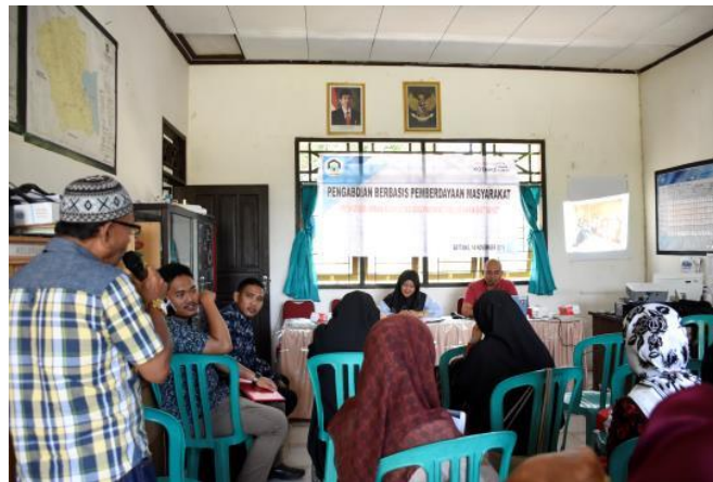
Gambar 1. Focus Group Discussion (FGD) bersama Kelompok Wanita Tani (KWT) Mandiri

Selama kegiatan seminar berlangsung, kelompok sasaran terlihat bersemangat dan antusias. Hal ini ditunjukkan dengan kehadiran anggota kelompok yang lengkap dan pertanyaan yang dilontarkan oleh beberapa anggota kelompok. Antusiasme semakin meningkat ketika pemateri mulai menjelaskan bahwa setiap orang mempunyai kelebihan masing-masing dan harus mengembangkan kelebihannya itu untuk hal yang positif.